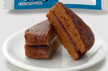
鹿児島県立市来農芸高等学校 考案 くろあんベリー 135円（税込145円）