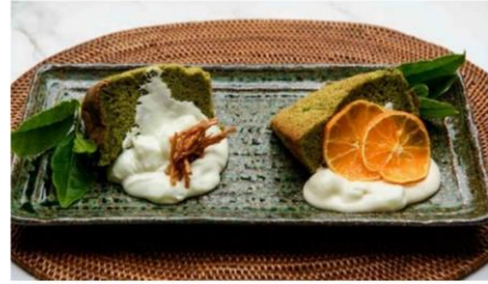
○入賞作品：霧茶シフォンケーキ & Rebornクリーム ○考 案：霧島高等学校

【商品名】鹿児島県立霧島高等学校考案『霧茶シフォンサンド～オレンジソース入り～』