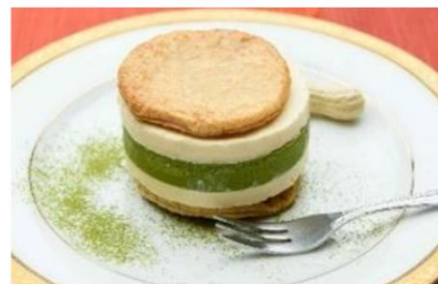
○入賞作品：地元愛 ○考 案：鹿屋女子高等学校

【商品名】鹿屋市立鹿屋女子高等学校考案『バタービスケットサンド（緑茶&チーズ）』