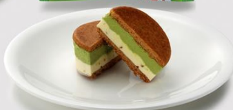
鹿屋市立鹿屋女子高等学校 考案 バタービスケットサンド（緑茶&チーズ） 260円（税込280円）