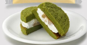
鹿児島県立霧島高等学校 考案 霧茶シフォンサンド 276円（税込298円）