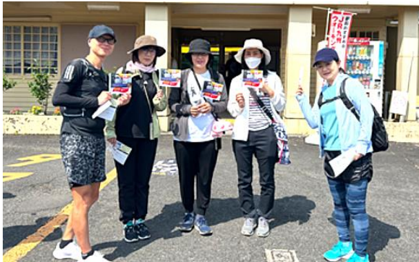
グループでウォーキングに取り組む社員

また、6社はそれぞれが主催するスポーツ関連イベントに相互に参加し、スポーツを通じて会社を超えた交流を深めています。