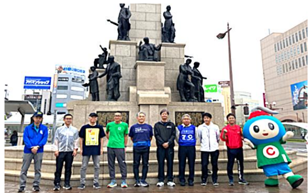
賛同企業が主催するスポーツ関連イベントに参加