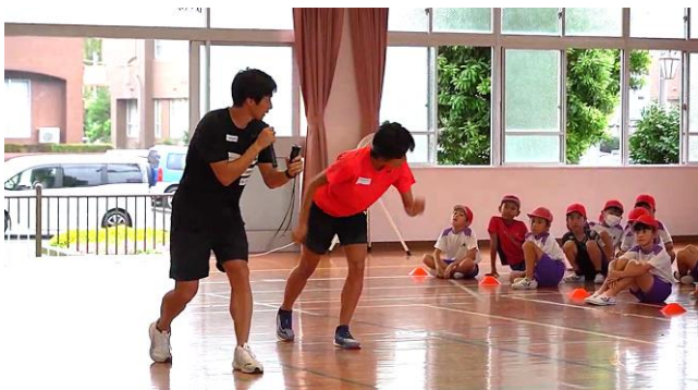
小中学生を対象とした陸上教室の開催