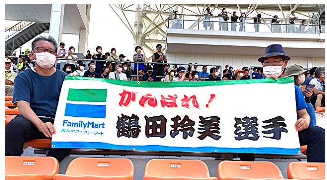
社員のスポーツ応援