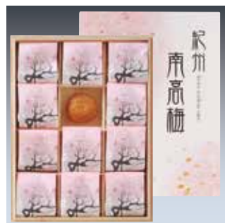
334 紀州梅干「南高梅」 (FB-30)…………… 税込3,680円