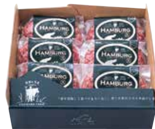
249 高鍋 藤原牧場 みやざきハーブ牛 手ごねハンバーグ (FJW-50) ..... 税込5,400円