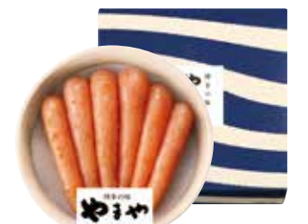
332 冷蔵 〈やまや〉 辛子明太子(無着色) (YBM-3G)…………… 税込4,171円