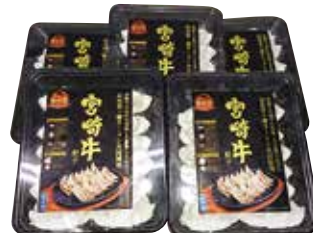
253 宮崎牛餃子セット (T-30) ..... 税込4,765円