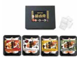
256 屋台骨 宮崎餃子詰合せ (YT-35) ..... 税込3,780円

生餃子・にら餃子・辛餃子・にんにく餃子 各1パック(12個入)、ラード・タレ付 1617