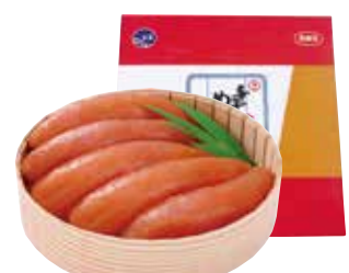
331 冷蔵 〈福さ屋〉 辛子明太子(無着色) (MMH-270)…………… 税込4,279円

ロースビーフ170g、生ハム45g、 2種の和風ソース40g、二段加熱あらびきポーク110g、 厚切あらびきソーセージ・あらびき薫しウインナー 各80g 6143