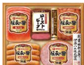
330 冷蔵 伊藤ハム 伝承の響 (IJ-301)…………… 税込3,955円

大根のそぼろ餡130g、 豚ロースの醤油煮込み70g×2、 豚ばらの味噌煮込み70g、 鶏肉と野菜の炊き合わせ150g 6143