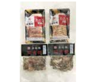
258 妻地鶏 炭火焼・タタキセット (A-33) ..... 税込3,280円

ラーメン(麺120g、スープ360g、チャーシュー40g)×4、辛子高菜100g、生餃子・にら餃子・辛餃子・にんにく餃子 各1パック(12個入)、ラード・タレ付 1617