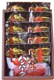
248 宮崎牛ハンバーグセット (MH-43) ..... 税込5,359円