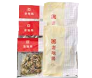
259 妻地鶏 炭火焼・チキン南蛮セット (B-38) ..... 税込3,981円

鶏炭火焼100g×3、チキン南蛮(鶏肉120g・タルタルソース50g・南蛮酢20g) 各2 1617