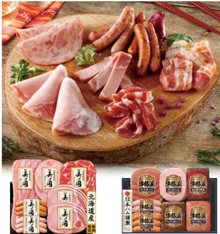
325 冷蔵 〈ニッポンハム〉 北海道 プレミアム 美ノ国 (UKH-38)…………… 税込3,955円

熟成ロースハム45g×2、熟成ベーコン48g、 肩ロース生ハム30g、熟成ピアシンケン40g、 熟成あらびきウインナー・ 白い熟成あらびきウインナー 各60g 6142