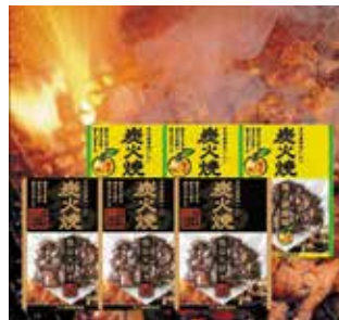
260 鶏炭火焼だより (TS-28) ..... 税込4,004円

鶏炭火焼100g×3、チキン南蛮(鶏肉120g・タルタルソース50g・南蛮酢20g) 各2 1617