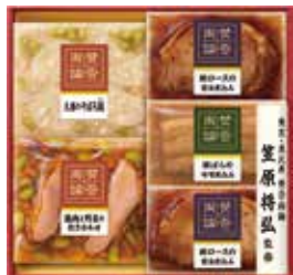
三抱指 産地・加工地直送(送料込) 329 冷凍 NEW 伊藤ハム 賛否両論 笠原将弘監修 (WA-30S)…………… 税込3,240円

辛子めんたいこ(中辛・昆布・ゆず) 各100g 原料原産地名 国産 ※賞味期間/冷蔵21日 6142