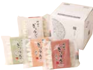
254 高鍋 中国料理 樹樹 ぎょうざ4種詰合せ (KK-1) ..... 税込4,765円

樹樹のぎょうざ・梅しそぎょうざ・海老ぎょうざ・トマトバジルぎょうざ 各10個入 1617