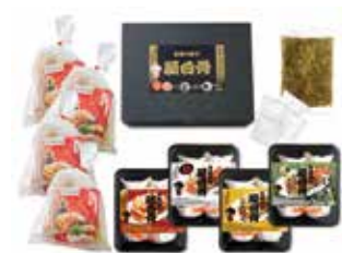
257 屋台骨 ラーメン・餃子セット (YT-55) ..... 税込5,940円

生餃子・にら餃子・辛餃子・にんにく餃子 各1パック(12個入)、ラード・タレ付 1617