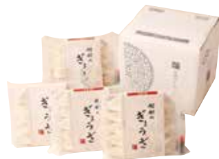
255 高鍋 中国料理 樹樹 ぎょうざ詰合せ (KK-2) ..... 税込4,495円

樹樹のぎょうざ・梅しそぎょうざ・海老ぎょうざ・トマトバジルぎょうざ 各10個入 1617