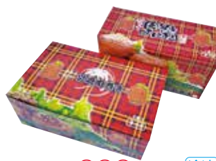
252 宮崎名物 肉巻きおにぎり詰合せ (HA-1) ..... 税込6,048円

宮崎黒毛和牛ビーフカレー・長崎黒毛和牛カレー・熊本あか牛ビーフカレー・鹿児島黒豚ポークカレー・大分豊後牛カレー・佐賀黒毛和牛カレー・博多和牛ビーフカレー 各160g 1617