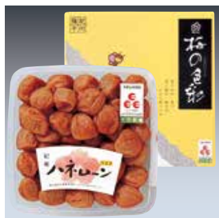
333 紀州梅干「ハネムーン」 (H30)…………… 税込3,680円