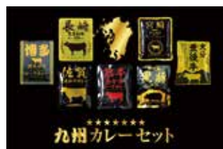
251 九州カレーセット (KK-07) ..... 税込3,464円

宮崎黒毛和牛ビーフカレー・長崎黒毛和牛カレー・熊本あか牛ビーフカレー・鹿児島黒豚ポークカレー・大分豊後牛カレー・佐賀黒毛和牛カレー・博多和牛ビーフカレー 各160g 1617