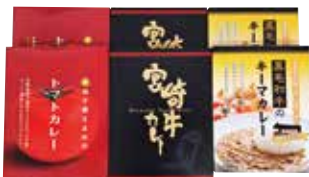
250 宮崎生まれのカレーセット (MY-GTW) ..... 税込3,356円