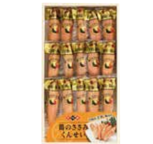
261 鶏のささみくんせい (KL-38) ..... 税込4,544円