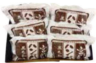
246 宮崎県産黒毛和牛と黒豚のハンバーグ (MHA-32) ..... 税込4,171円