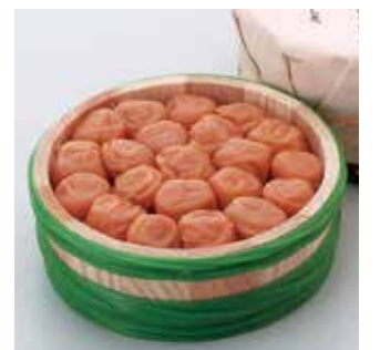
336 紀州梅干「あが家の梅」 (U-40)…………… 税込4,760円