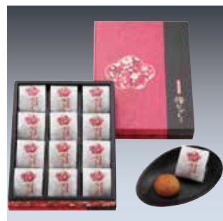
335 紀州南高梅「梅なでしこ」 (12粒)…………… 税込3,680円