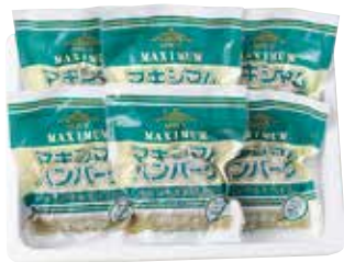
247 マキシマムハンバーグ (MH-34) ..... 税込4,387円